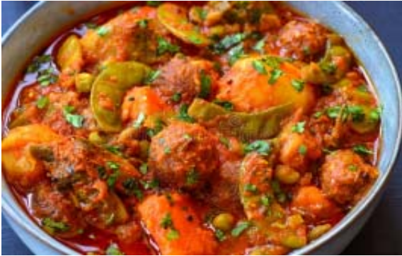
સામગ્રી : મૂઠિયાં બનાવવા માટે : જીણી સમારેલી

મેથી ૧ કપ, ચણાનો લોટ પોણો કપ, ઘઉંનો કરકરો લોટ પા કપ, આદુ-મરચાંની પેસ્ટ ૨ ચમચી, હિંગ પા ચમચી, ખાંડ ૧ ચમચી, બેકિંગ સોડા પા ચમચી, હળદર પા ચમચી, પાણી જરૂર મુજબ, મીઠું સ્વાદ મુજબ, તેલ તળવા માટે.